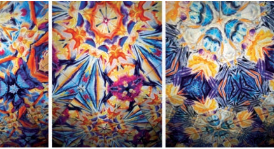
Kaleidoskop-Installation. Yvonne Kirchner

Es geht ihr um einen positiven Gegenentwurf zu einer eher negativ gefärbten Gegenwartskunst.