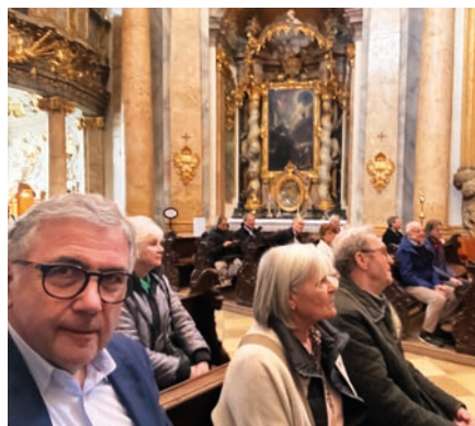
Die Teilnehmer erlebten eine beeindruckende Führung in der Asamkirche St. Georg.