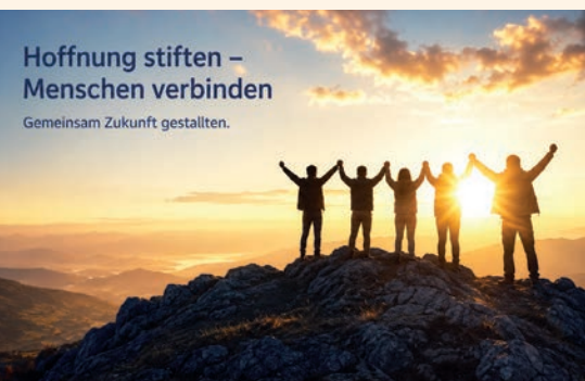
Hoffnung stiften – Menschen verbinden Gemeinsam Zukunft gestalten.

„Der Gott der Hoffnung aber erfülle euch mit aller Freude und Frieden im Glauben.“