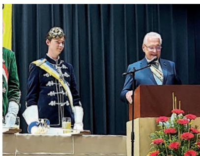
Auch der CV hatte zu einem großen Katholikentags-Convent geladen. Staatsminister Joachim Herrmann, auch ein KKVer, hielt den Festvortrag.